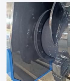
Защитный кожух для подшипников