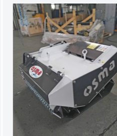
Выбор доступных цветов