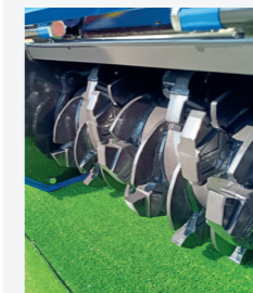
DCR ротор технология ограничения реза