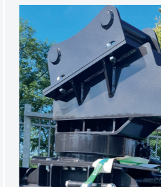
Ротатор 180° опция