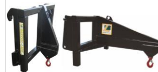
Крюк грузоподъемный Н50

!!!ВАЖНО: Пользователь должен соблюдать все меры предосторожности и безопасности!!!