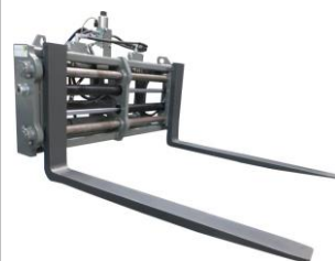
Вилы паллетные Н20-21-22